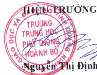
Nguyễn Thị Định